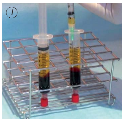
7. Veuillez à garder le kit vertical, retirez délicatement le piston. A l'aide de l'aiguille 25G, prélevez les 3 ml de PRP au plus près du culot sans le toucher.