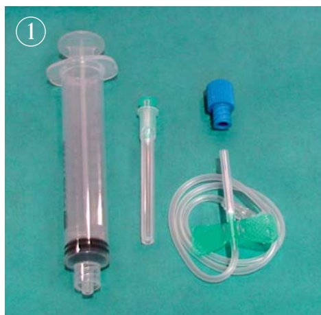
1. Ouvrez le champ stérile et déposez les différents composants dessus.