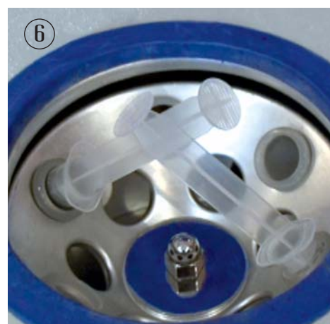
6. Centrifugez pendant 5 minutes à 700g (soit 2500 tours par minute).