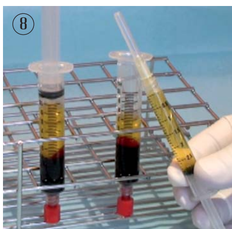
8. Montez l'aiguille 30G et injectez. Mêmes étapes pour la 2 ème seringue.

L'ECO-KIT P.R.P est un assemblage de plusieurs composants. Chaque produit a son propre marquage CE.