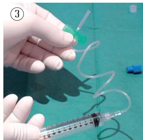
3. Montez le butterfly de prélèvement sur la première seringue, prélevez 10 ml.