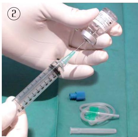
2. Mettez l'anticoagulant (CDA) dans les seringues à raison de 0.8 ml pour une seringue de 10 ml.